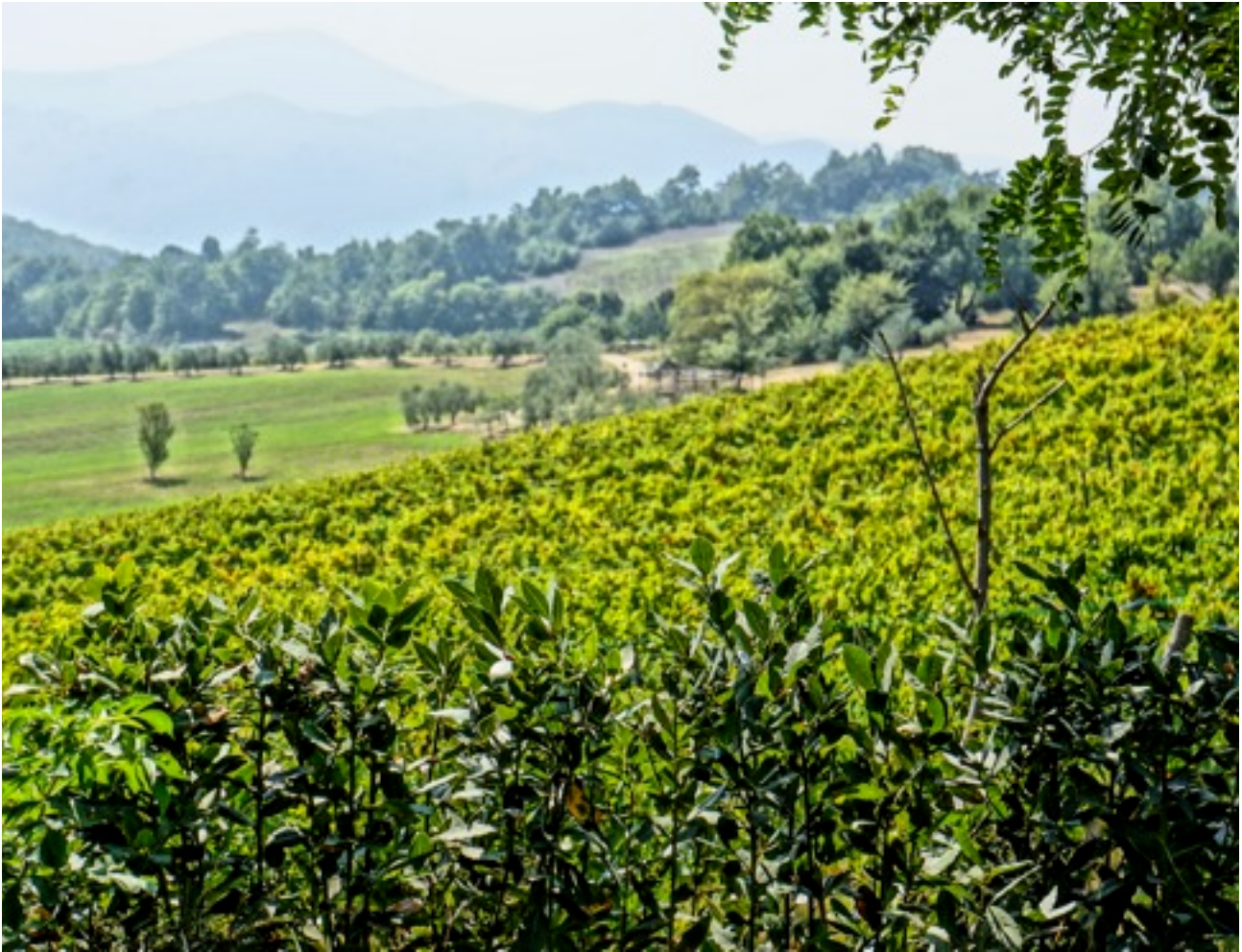
Vigneti nella campagna a nord di Capua