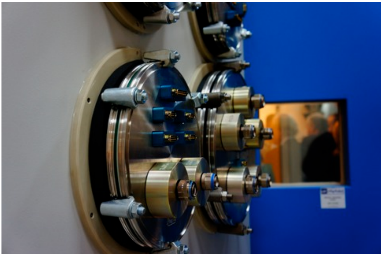
Laboratori del Cira, a Capua