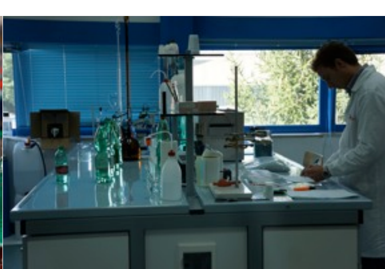
Eccellenze casertane: l'imbottigliamento di acque minerali della Ferrarelle, a Riardo