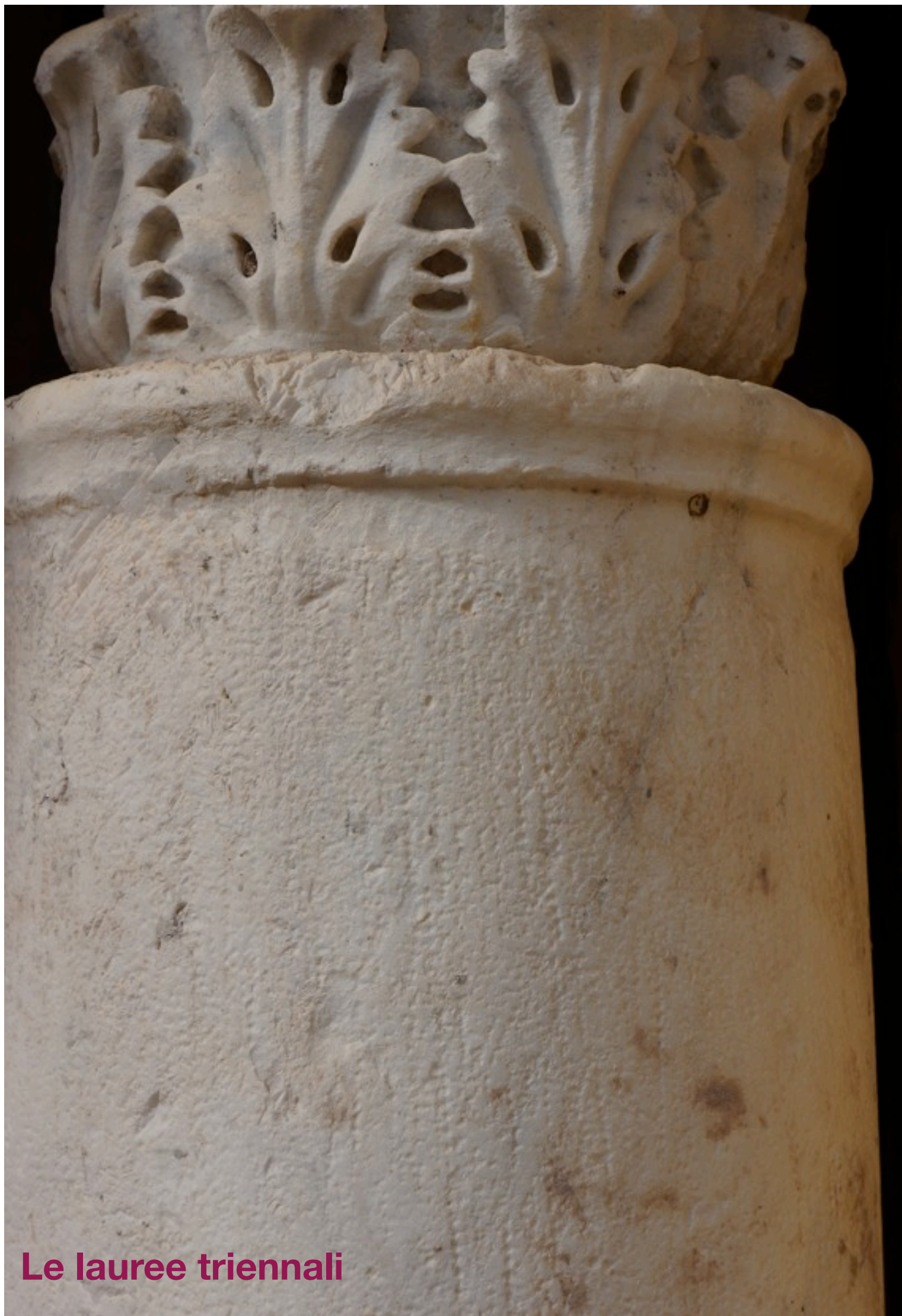
Le lauree triennali