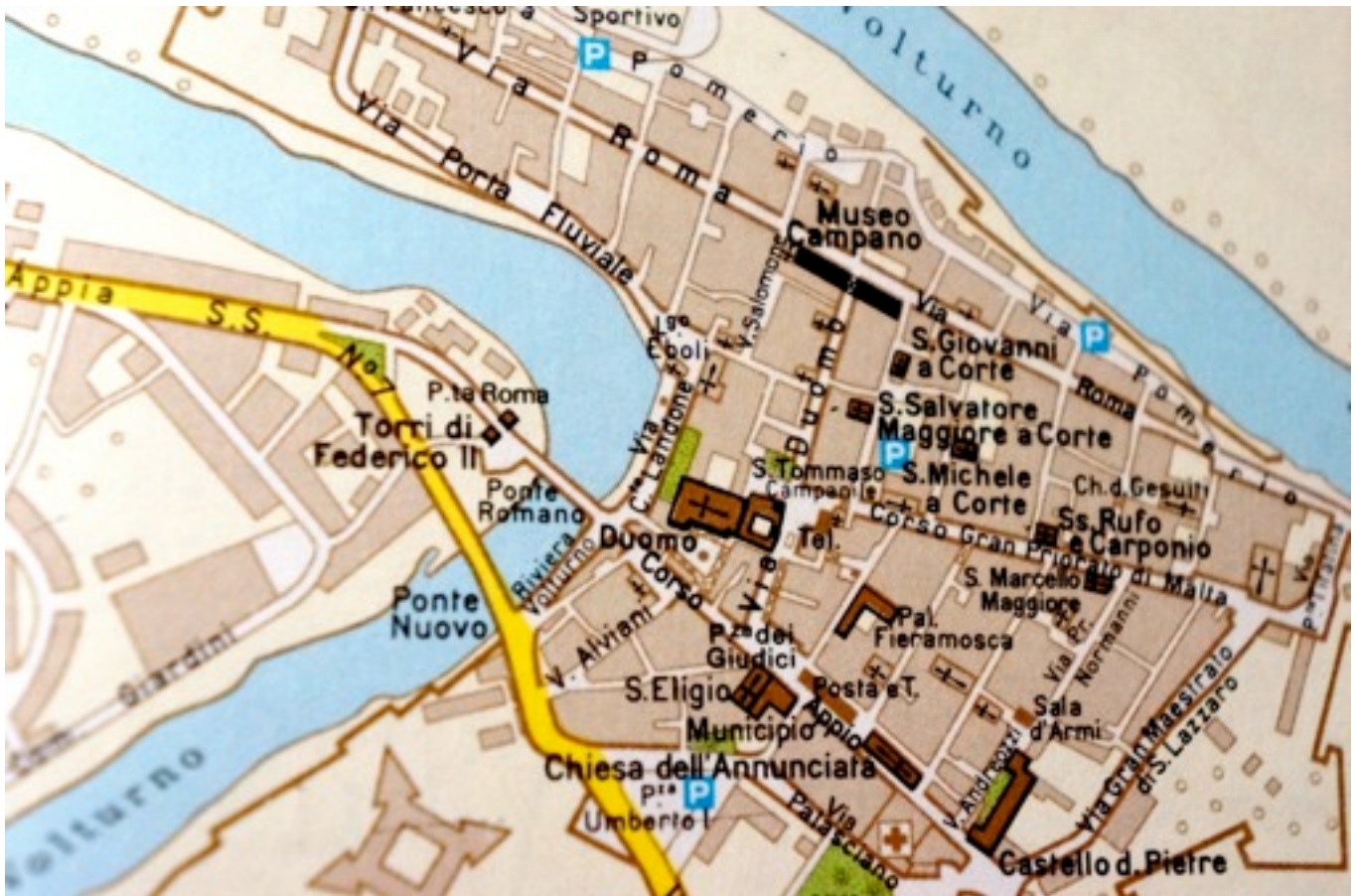
La mappa di Capua nella Guida Rossa del Tci