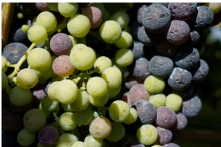
Grappoli d'uva nella campagna di Capua

Economia e management | Management e controllo Economia e management | Dottori commercialisti Economia e management | Marketing Economia, finanza e mercati | Economia e sviluppo territoriale Economia, finanza e mercati | Finanza per i mercati Economia, finanza e mercati | Economia internazionale